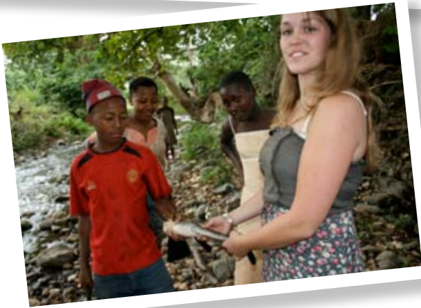
Een stukje educatie....., nu nog buiten....