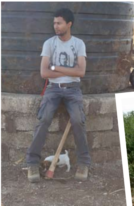
Het waterresevoir geplaatst...