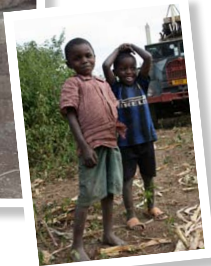
De bouw gaat beginnen...