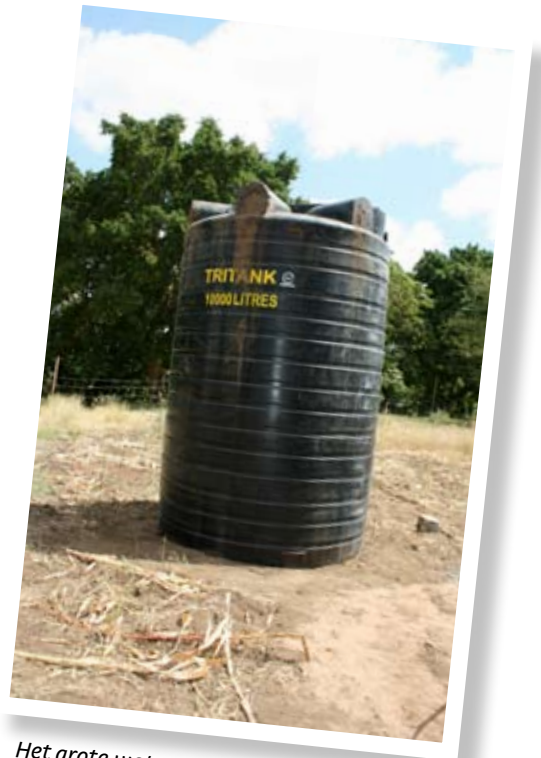
Het grote waterreservoir...