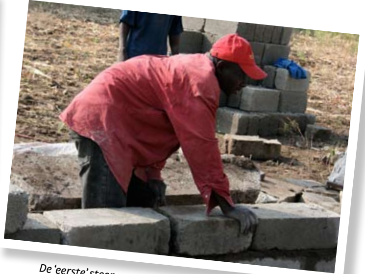
De 'eerste' steen...