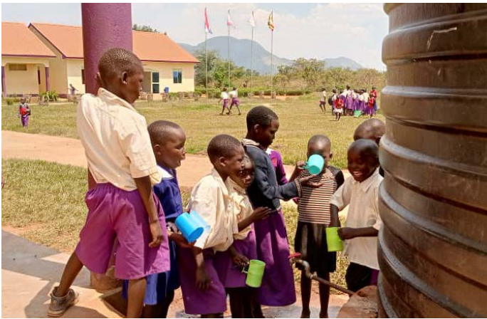
We drinken er schoon water bij.