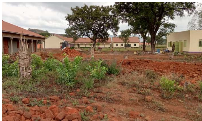
Bij de keuken (gebouw rechts op de foto) krijgen we 's ochtends een beker pap.