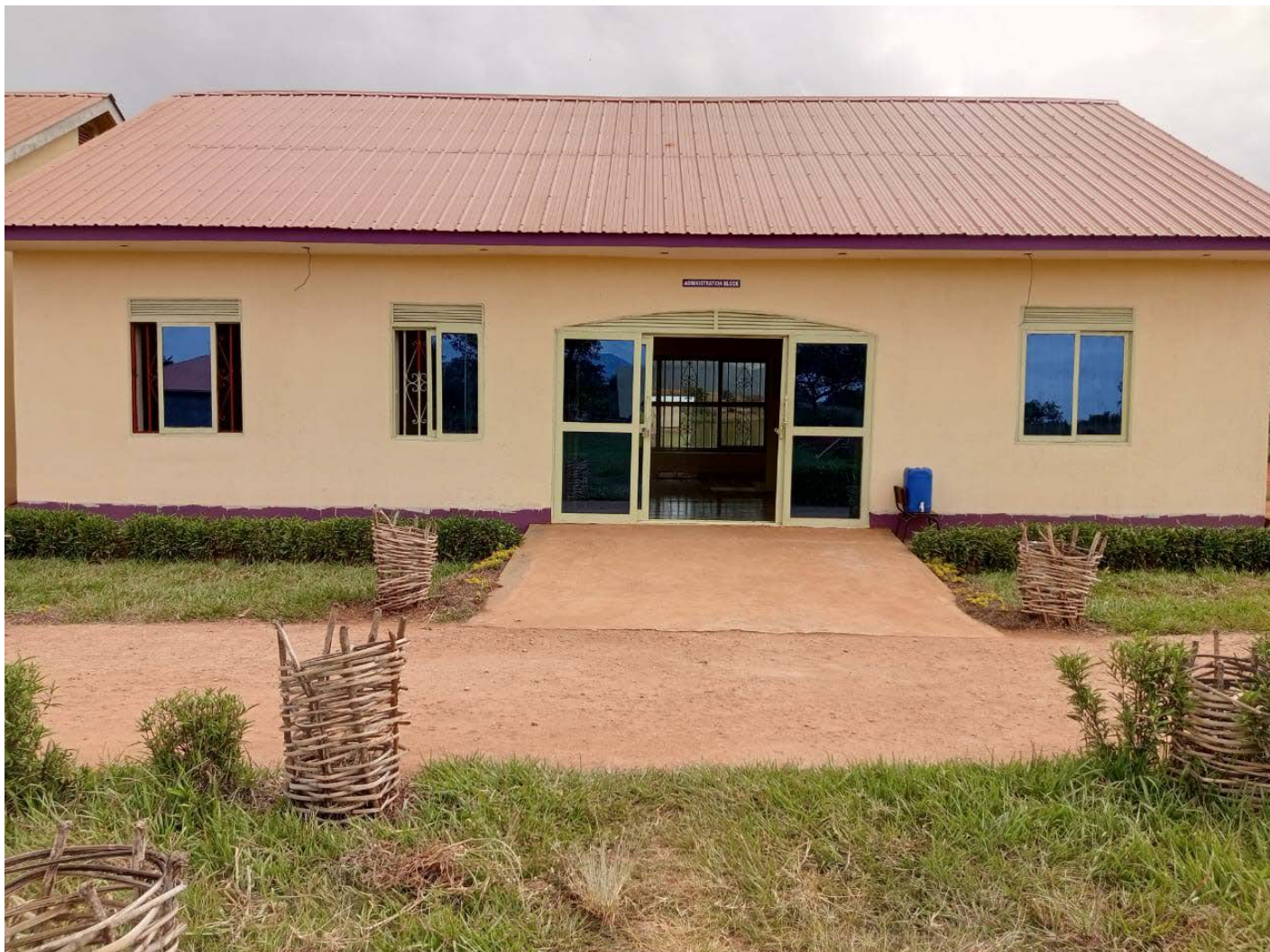
We lopen van huis langs de mooie entree van de school.