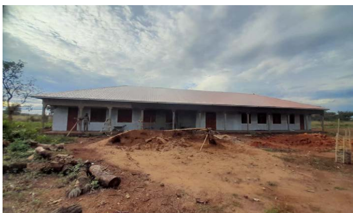
Of we hebben geslapen in één van de slaapzalen.