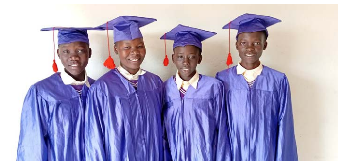
4 trotse jongens die klaar zijn op de basisschool. Zij zijn Run for Rio en haar donateurs zeer dankbaar dat zij op de Blessed Land school hun opleiding mochten doen.