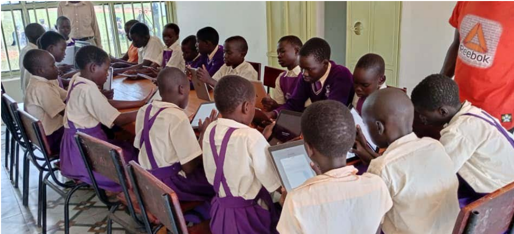
De grote kinderen krijgen computerles.