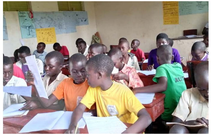
Wij beginnen vandaag met Engelse les.