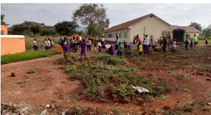
Einde schooljaar ruimen we met elkaar alles op.